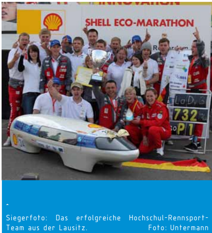
Siegerfoto: Das erfolgreiche Hochschul-Rennsport-Team aus der Lausitz.

Nach drei Jahren auf dem brandenburgischen Lausitzring fand der Shell Eco-Marathon 2012 erstmals auf einem Straßenkurs in Rotterdam statt. Das hinderte das Team Lausitz Dynamics der Hochschule Lausitz nicht daran, in der Kategorie der batterieelektrisch betriebenen Fahrzeuge den ersten Platz abzuräumen. Insgesamt verzeichnete der viertägige Eco-Marathon rund 40.000 Teilnehmer und Besucher. Im Mittelpunkt des Wettbewerbs steht die Frage: Wie weit kommt man mit einer kWh Leistung oder einem Liter Treibstoff? DU