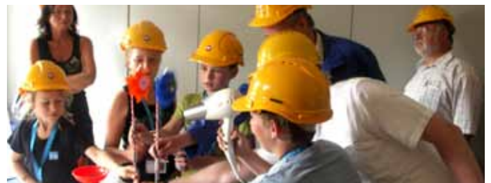
Auf Entdeckerreise ins Heizkraftwerk Senftenberg: Mitglieder des VDIni-Clubs Lausitz.

Höhe der Kesseldecke folgte der Aufstieg zur noch höher gelegenen Decke des Kohlestaubsilos. Und mit einem beeindruckenden Blick auf das Lausitzer Seenland endete die erste VDIni-Entdeckerreise des VDIni-Clubs.