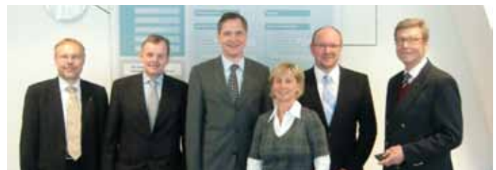
Bereiteten die Kooperation vor: Vertreter des VDI und der TSB.